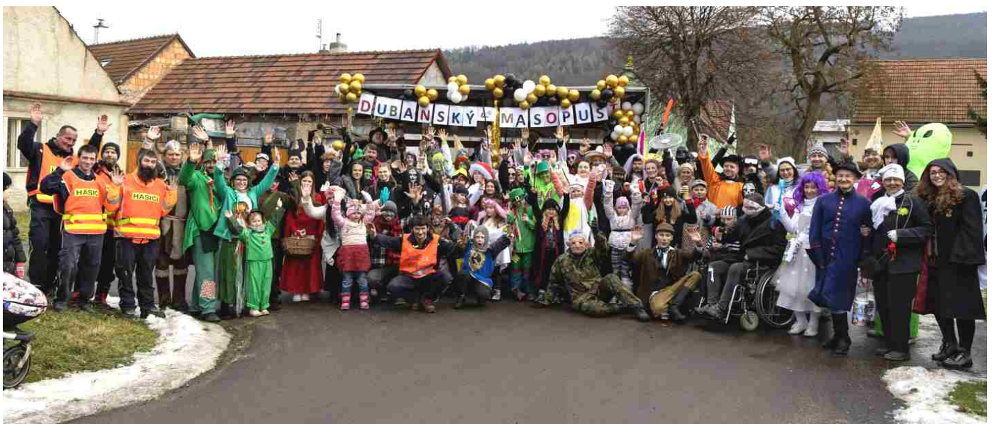
6. dubanský masopust se opět vydařil. Příspěvek a fotoreportáž najdete na straně 12