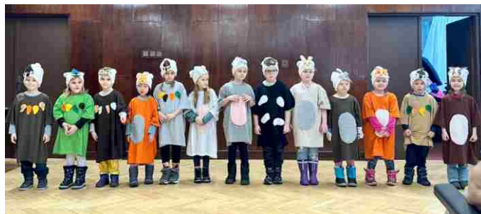
Vystoupení v domově důchodců pohádku a užili jsme si cestu vlakem. Líbilo se nám to moc a těšíme se, co nám tento školní rok ještě přinese!