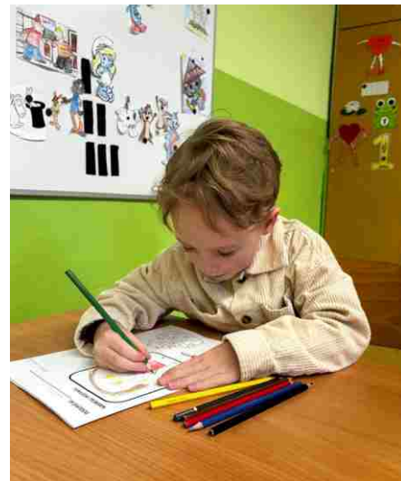
Zápis do první třídy

V okresním kole se setkaly s talentovanými vrstevníky z našeho regionu a ukázaly, že patří mezi žáky, kteří mají k angličtině velice blízko. Jejich výkony byly velmi pěkné. Za jejich snahu, přípravu a odvahy jim patří velké poděkování.