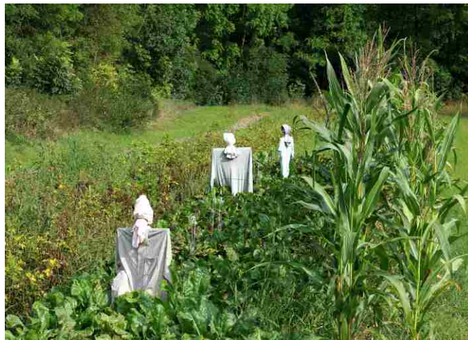
Strašáci na záhumenku u Podbradce

Křoviny opravdu pohltily všechny kdysi kultivované plochy kolem potůčku, itzv. palouk, bývalý sad s panenskými jablky a jinými starými odrudami jabloní. Stal se však zázrak, vlastně mimořádná souhra náhod, způsobivší zachování, a dokonce opravu čili zrestaurování mostku. Byl zachován díky tomu, že z obce přes něj vede příjezd k transformátoru, napájecímu zřejmě elektrickým proudem celou obec. Dále od transformátoru pak vede starobylá křovím obrostlá cesta do polí a navazuje na