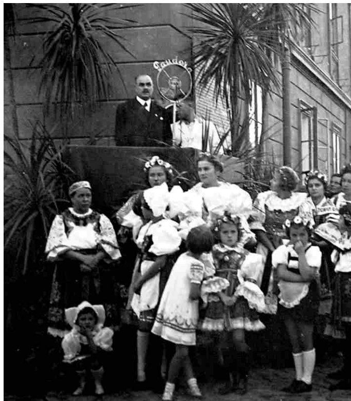
Fotografie č. 3

Zároveň při této příležitosti dala městská rada 15. 5. 1937 souhlas, aby doposud národní školy v Libochovicích nesly název