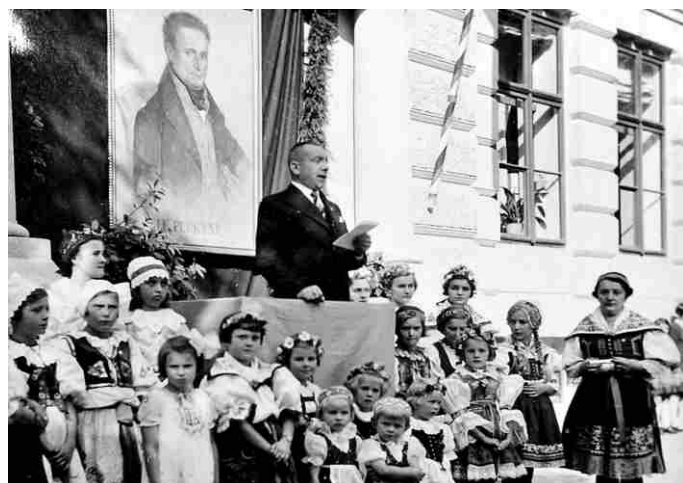
Fotografie č. 5