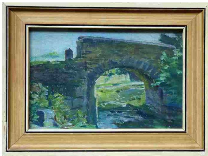
Obrázek od J. A. Zázvorky, jenž zavedl příčinu k pátrání