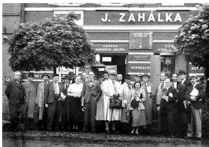
Fotografie č. 4