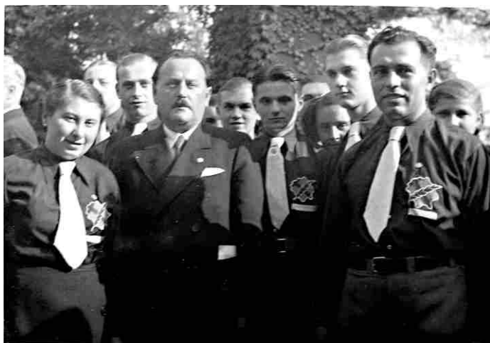
Fotografie č. 1