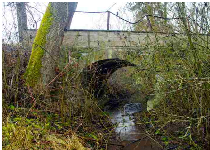
Mostek přes Podbradecký potok (13. 3. 2025), zřejmě totožný s mostkem z obrázku

zmíněnou cestu do „Podbradeckého háje“. Ten mostek je také kouskem historie zdejší krajiny, ale takové mistrně utvořené, a proto obdivuhodné a krásné artefakty se na seznamech památek málokdy ocitají. V případě Podbradce se zpravidla jako význačná pamětihodnost uvádí pouze kaple sv. Floriána z r. 1790 s hranolovou věží. Domnívám se, že mostek je možná stejně starý.