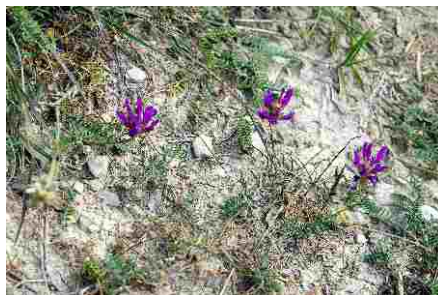
Kozinec vičencovitý, dne 3. 7. 2022.