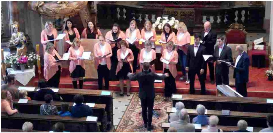
Pěvecký sbor Melodie vystoupil u příležitosti Noci kostelů.