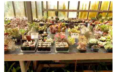
Skupina nekaktusových sukulentů.

Největšího ocenění se pořadatelé dočkali od členů výboru SPKS Praha, kteří opakovaně prohlásili, že v Libochovicích jsou vystaveny mnohem kvalitnější výpěstky (exponáty). Mezi nejčastěji fotografovanými rostlinami byly kvetoucí druhy rodu Echinocereus, které jsou mrazuvzdorné. Na výstavě bylo i letos KOLO ŠTĚSTÍ, které využili nejenom žáci místní ZŠ, ale i řada dospělých, kteří neváhali za 2 Kč vyzkoušet loterii, v níž mohli vyhrát sazenice kaktusů dle vlastního výběru. text a foto J. Gratiás