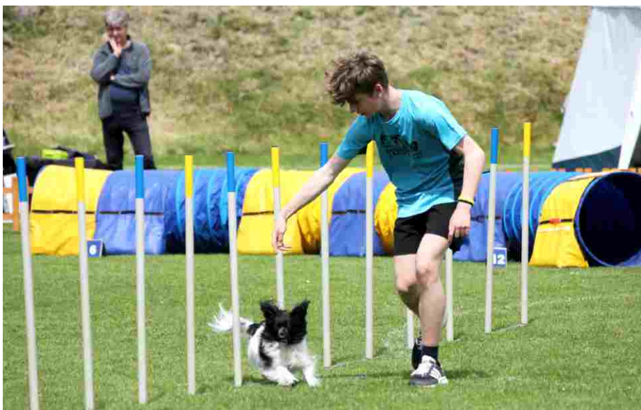
Radovesické agility s Pohodou.

Závody se mohly uskutečnit díky radovesickému fotbalovému klubu, který poskytl pro sportovní akci perfektně upravený fotbalový stadion i s jeho zázemím, za což fotbalistům děkujeme. Velký podíl na zajištění závodů má také město Libochovice, které dlouhodobě finančně podporuje náš spolek a s tím i spojenou obměnu našeho sportovního náčiní především překážek. Odměny pro účastníky závodů pak poskytla firma Platinum Natural Česká republika, Od Radky – výcvikové potřeby a přetahovadla pro pejsky, Nakladatelství Plot,