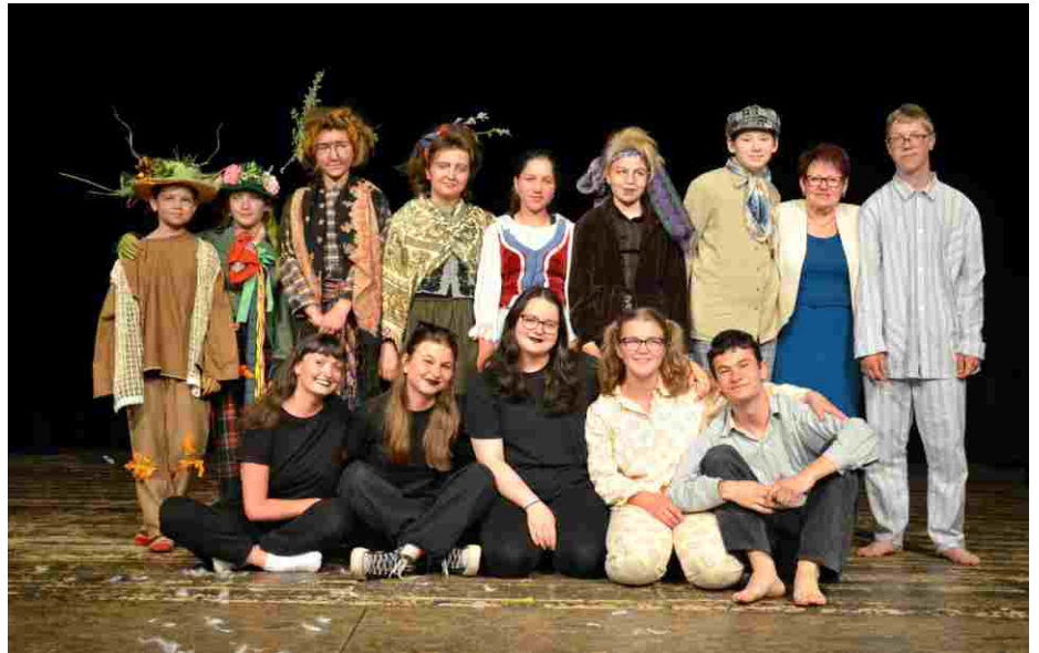
MALIS - dětská část spolku Scéna Libochovice.

Na závěr je třeba poděkovat nejen organizátorům, ale velké díky patří hlavně městu Libochovice za celkovou podporu, jak finanční, tak materiální, fyzickou i psychickou. Díky patří též Ústeckému kraji a všem sponzorům, donorům a podporovatelům. Díky těmto všem se daří udržet Libochovické diva-