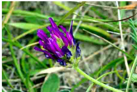
Objekt zájmu je fotogenický.