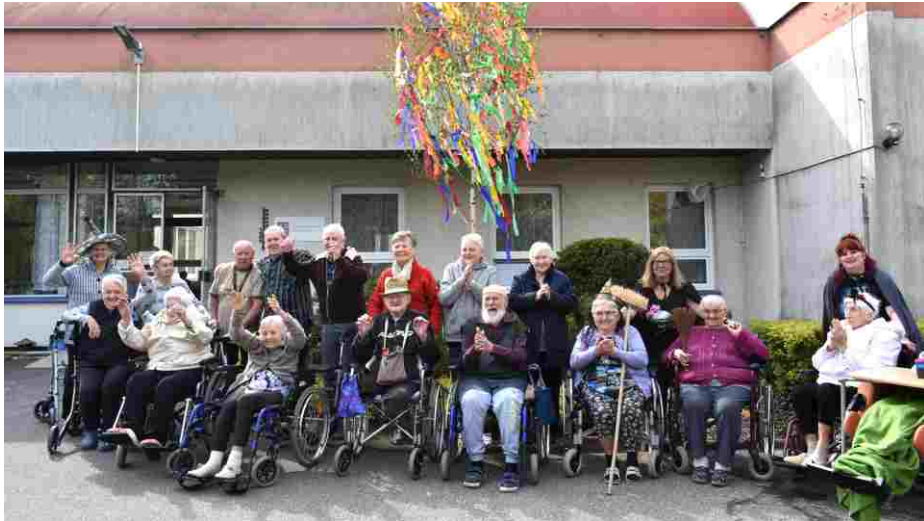
Oslava Čarodějnic v Domově důchodců v Libochovicích.