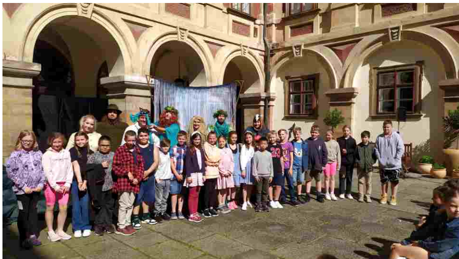
Opera Rusalka na nádvoří zámku.

Ve Zlaté uličce nezabloudili, a tak mohli dále pokračovat Nerudovou ulicí až na Karlův most. V Klementinu si vyslechli pověst o ukrytém pokladu a na orloji viděli jen 9 apoštolů. V Židovském městě si připomněli další z pověstí, tentokrát o Golemovi. A protože byli pozornými posluchači a paní průvodkyně je pochválila, za odměnu si při zpáteční cestě užili i „mekáč.“