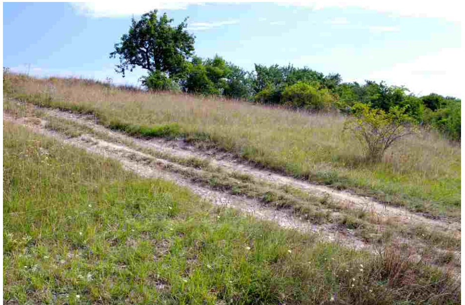
Naleziště vzácného kozince vičencovitého u Ředhoště.