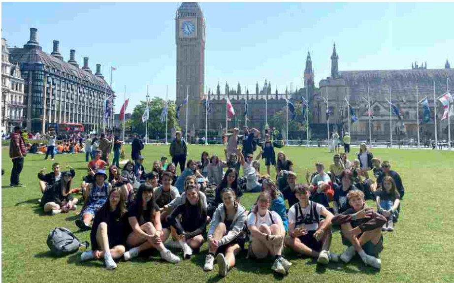
Poznávací zájezd do Anglie.