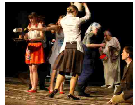
SUMUS Praha - představení Utíkej, smrtko, utíkej.