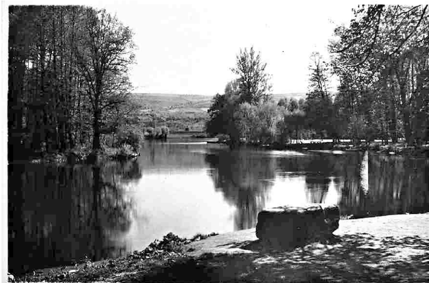
Partie pod kostelem. (z mizela r. 1938.)