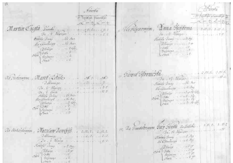
Urbář panství z roku 1675, město Libochovice.

Složitost rodopisného pátrání ovlivňuje postavení a řemeslo našich předků. Pokud náš předek byl na selském gruntu, budeme mít zápisy členů rodu v jedné obci nebo v jedné farnosti a rodina zůstávala na jednom místě. Velikost gruntu byla rozdělena jejich výměrou jednoho lánů (cca 18 ha) s názvem sedlák – láník či celoláník. Poloviční byl chalupník – půlláník a čtvrtinový sedlák byl domkář – čtvrtláník. Dále může být zapsán náš předek jako polní zahradník, který měl jen malý domek se zahrádkou. V zápisech můžeme najít také název gruntovník, usedlík, hospodář, rolník. Pokud náš předek předal selský grunt svému synu,