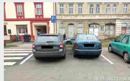
Parkování na náměstí.