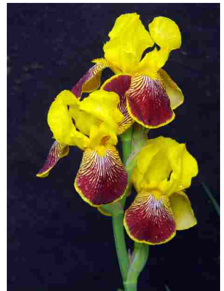
Kosatec ze vzpomínek na Libochovice.