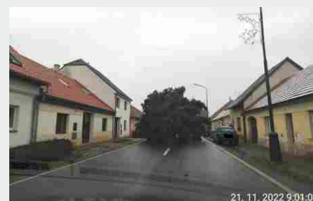
Převoz vánočního stromu.