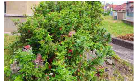
Nostalgii vyvolaly i zarostlé zpustlé trosky naivního zahradního umění s modelem hradu.