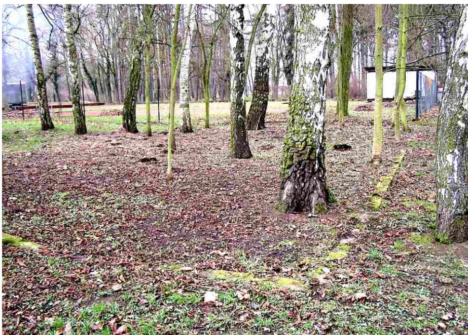
Obrázek č. 5 - stav bývalých lázní v roce 2015.

krizi by se našlo tolik volných finančních prostředků k uskutečnění tohoto projektu.