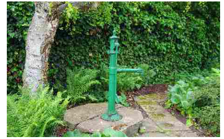
Zmíněná studna s pumpou tam ještě byla, ale trpaslíček nikde.