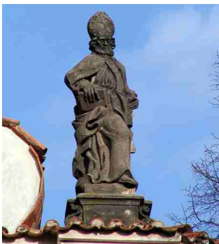
Obrázek č. 9