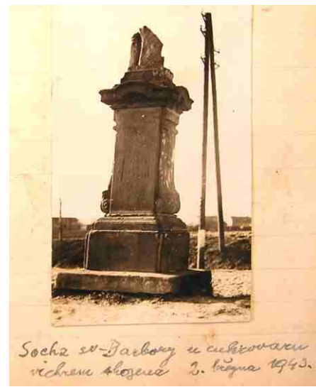
Obrázek č. 14