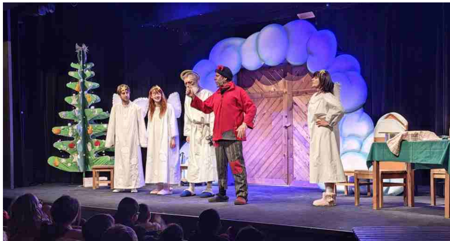
Výlet na divadelní představení do Mostu