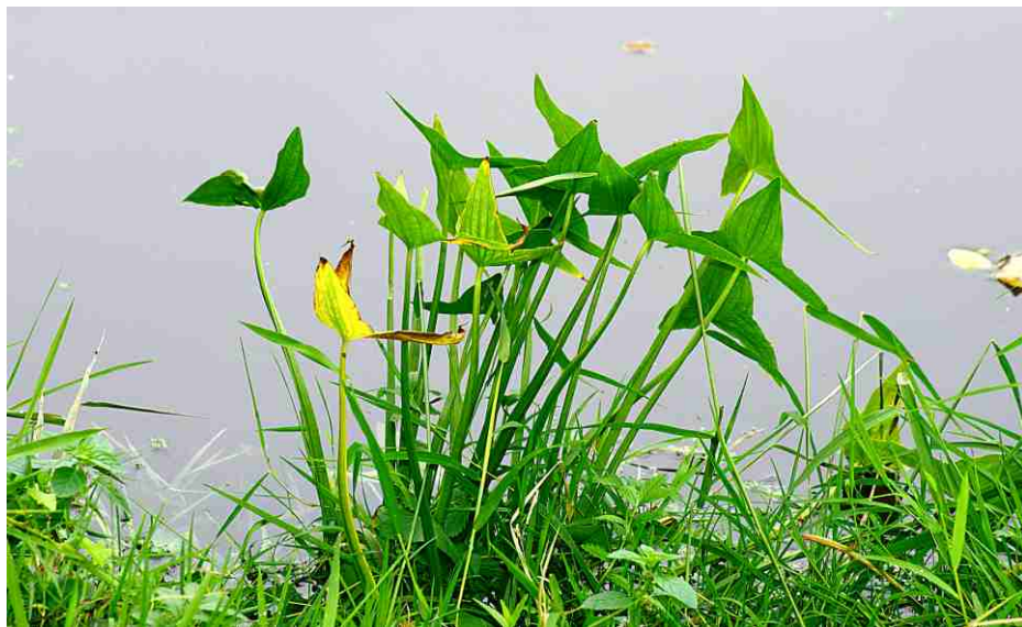
Šípatka střelolistá u Zátoky, 12. 9. 2024

V Libochovických novinách 2023/8 jsem popsal nalezení půvabné obojživelné rostliny šípatky střelolisté ( Sagittaria sagittifolia ) v libochovické Zátocce po mnoha letech. Popsal jsem také její zvláštní způsob života, a také to, že její výživné hlízy z bahna vybírají divoké kachny. Článek o šípatce jsem tehdy končil tím, že „bude-li se v dalších letech množit díky tvorbě dceřiných hlízek, jsou kachny v případě dávného vyhynutí šípatky v Libochovicích přece jen nevinné“. Roku 2024 jsem na Zátocce tuto již vzácnou šípatku opět objevil, ale na jiném místě. Příběh dostal, po stránce ekologie druhu, nečekané pokračování. Musel jsem se pousmát, když jsem viděl, jak tato rostlina ošálila svoje ničitelky – kachny! Stojí to za zmínku.