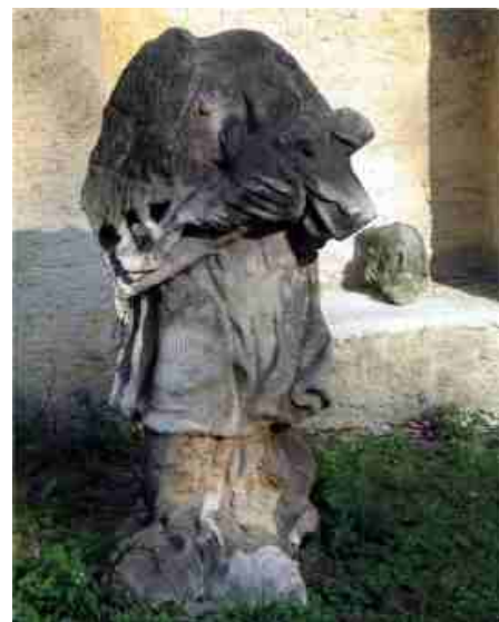
Obrázek č. 19