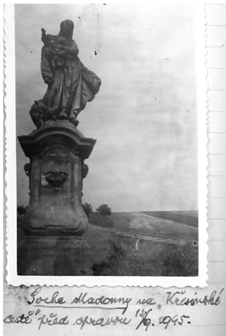
Obrázek č. 12