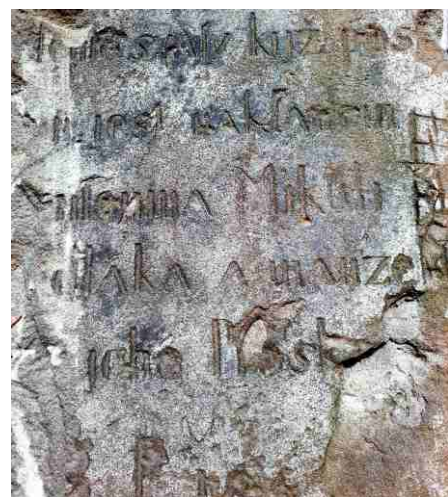
Obrázek č. 18

soch z r. 1852, s poznámkou „zachování sochy této majiteli živnosti sedlské v Slatině pod č.p. 9 za povinnost na všechny