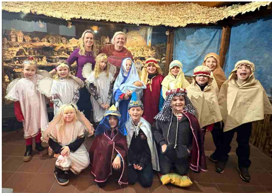
2.C naštvila betlém v Bechlíně

V příjemném domácím prostředí venkovského statku si děti vyrobily postavu čertíka z barveného kukuřičného šustí. Pak se přesunuly k betlému, kde začala projekce dávného příběhu. Prohlédly si pohyblivé figurky, zobrazující poklidný život ve vesničce pod horou Říp. V poslední části programu se převlékly do připravených kostýmů a vytvořily tak vlastní živý betlém.