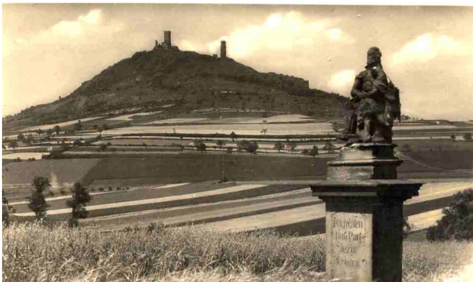
Obrázek č. 11

26. listopadu 1720 žádal p. Buk, aby je-