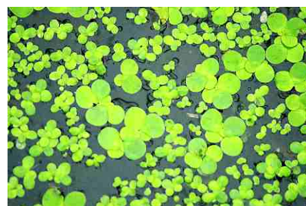
Závitka mnohokořenná (velké „penízky“) spolu s okřehekem menším na Zátocce. Skutečná velikost „penízků“ 6-8 mm