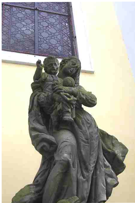
Obrázek č. 13