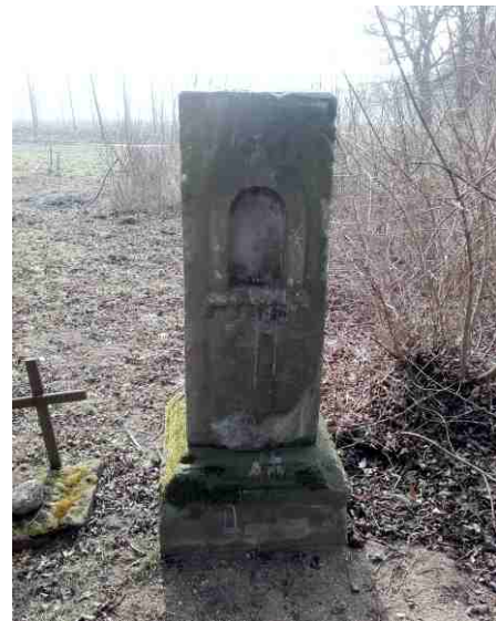
Obrázek č. 17