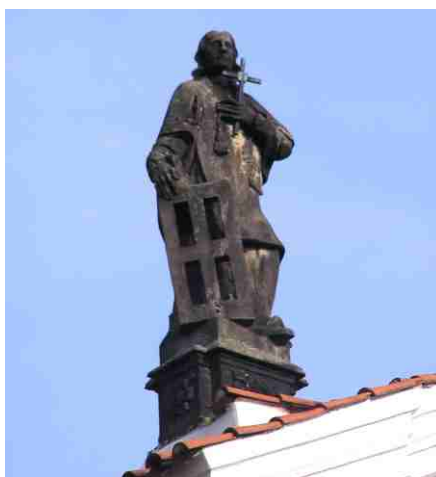
Obrázek č. 10

Na odvrácené stěně podstavce je text, který dokládá coby donátora děkana p. Gallase: