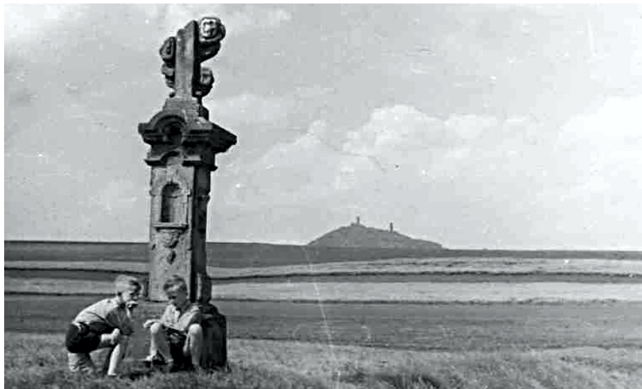
Obrázek č. 16