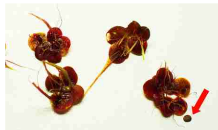
Závitka mnohokořenná je naspodu nachována. Šípka ukazuje na právě odpadlý turion