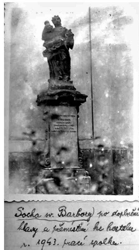
Obrázek č. 15