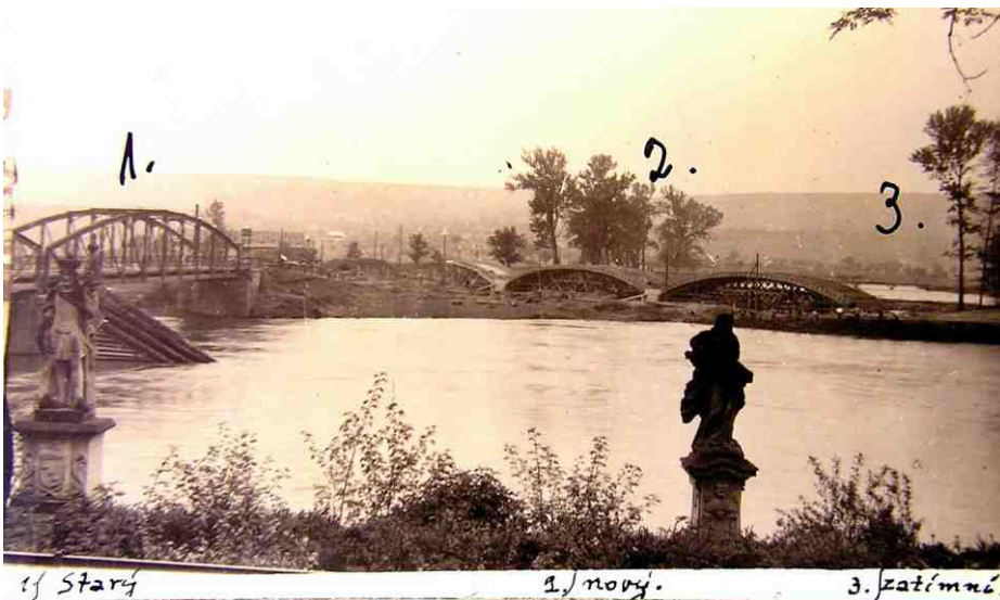
3 mosty u Libochovic, 1936.