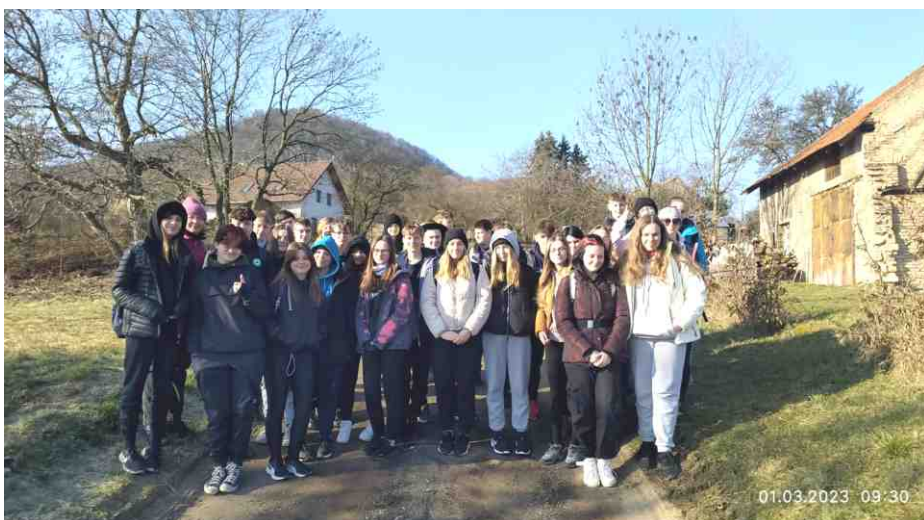
Zeměpisná exkurze na Boreč.