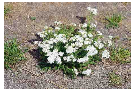
Řebříček štětínolistý, vzácný a ekologicky zvláštní druh na hazmburské vrcholové planině navštěvované turisty.