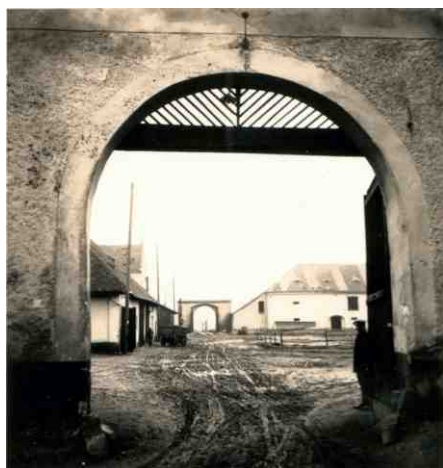
Panský dvůr od města.