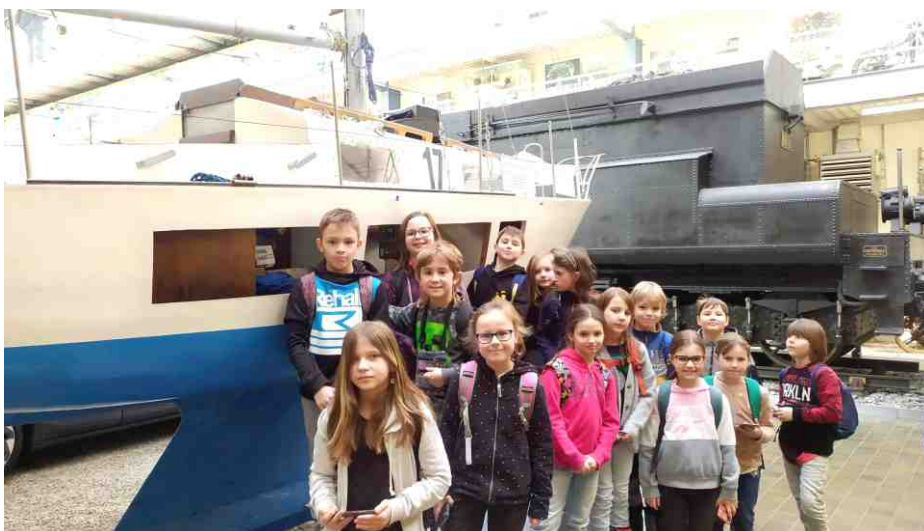
3.B v Národním technickém muzeu.