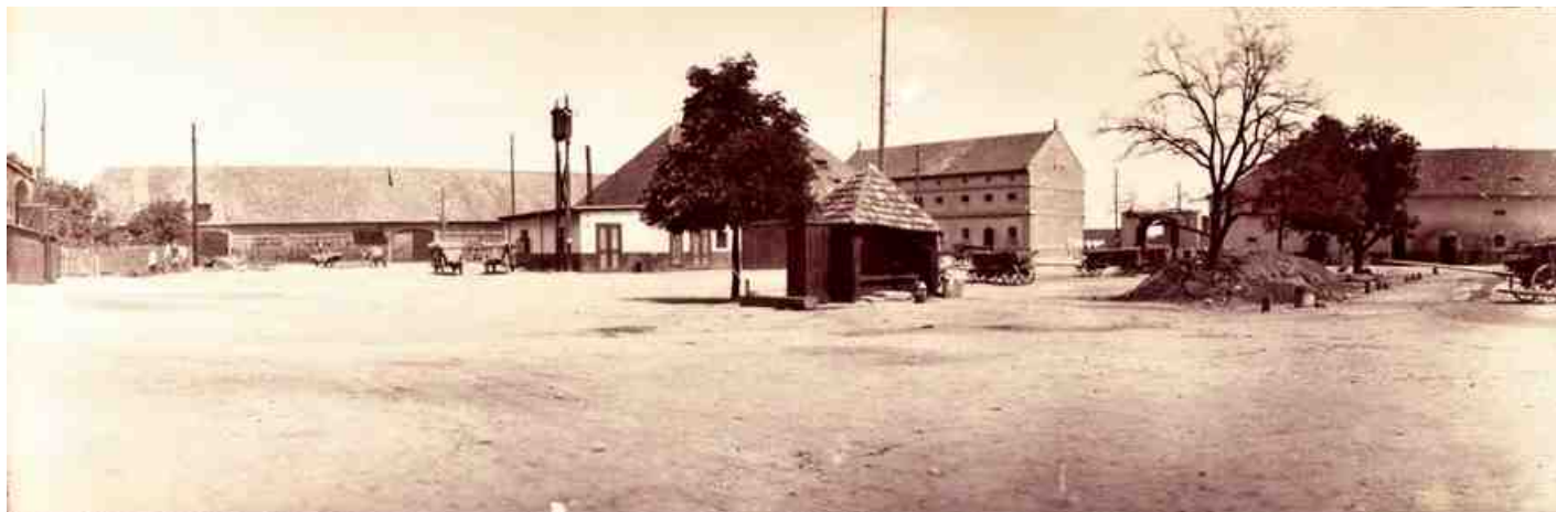
Panský dvůr - panorama.

Hraběcí hospodářský dvůr čp. 128, dnešní plocha autobusového nádraží a KB bloku. Naproti přes ulici, Havlíčkově (původně Budyňské), byl zhruba v prostoru od dnešního čp. 167 až 211 dobytčí trh. Tento dvůr byl jedním z nejstarších a největších v okolí na libochovickém panství.