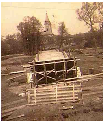
Pilíře, 29. 6. 1936.