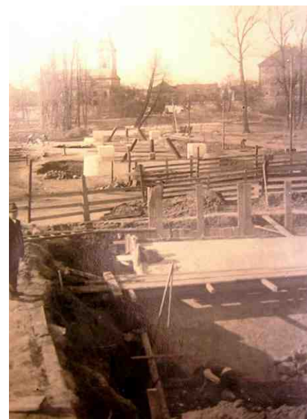
Mizí „starý mlýn“, 21. 3. 1936.