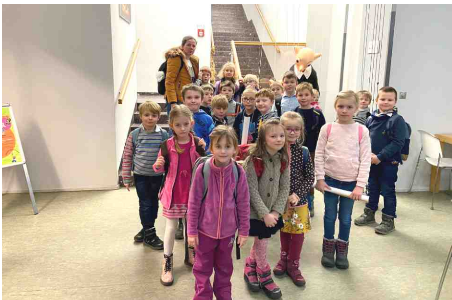
Děti z 1.A navštívily Divadlo Spejbla a Hurvínka.