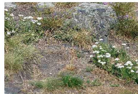
Blokované sukcesní stadium s řebříčkem štětínolistým, 26. 5. 2022.