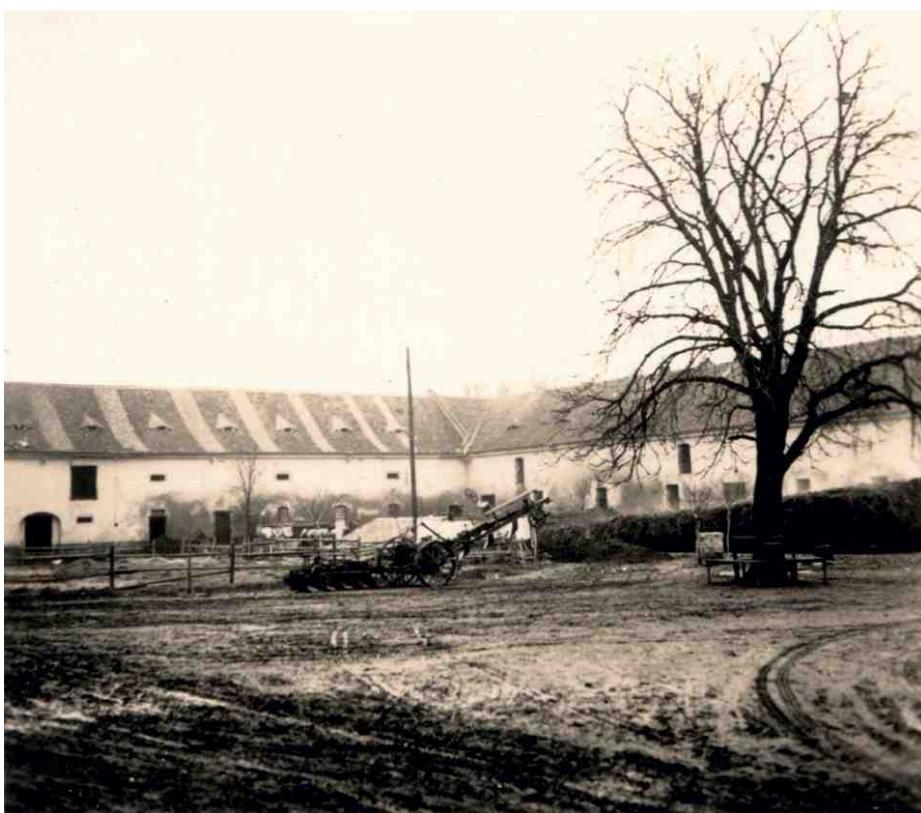
Panský dvůr - stodoly a stáje.