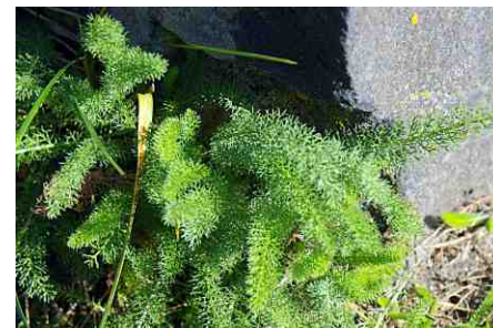
Řebříček štětínolistý, typické trojrozměrné uspořádání listových úkrojků.