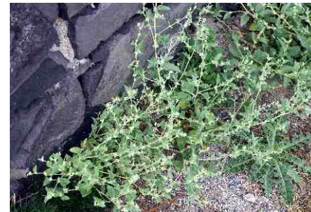
Lebeda růžová, jeden z nejvzácnějších druhů české květeny na Hazmburku.