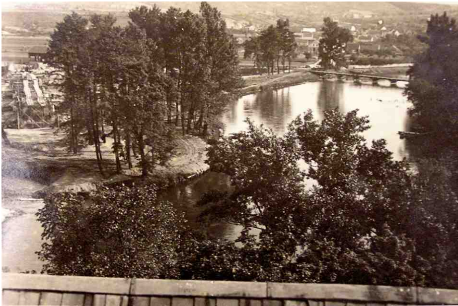
Stavba nového mostu a regulace Ohře.