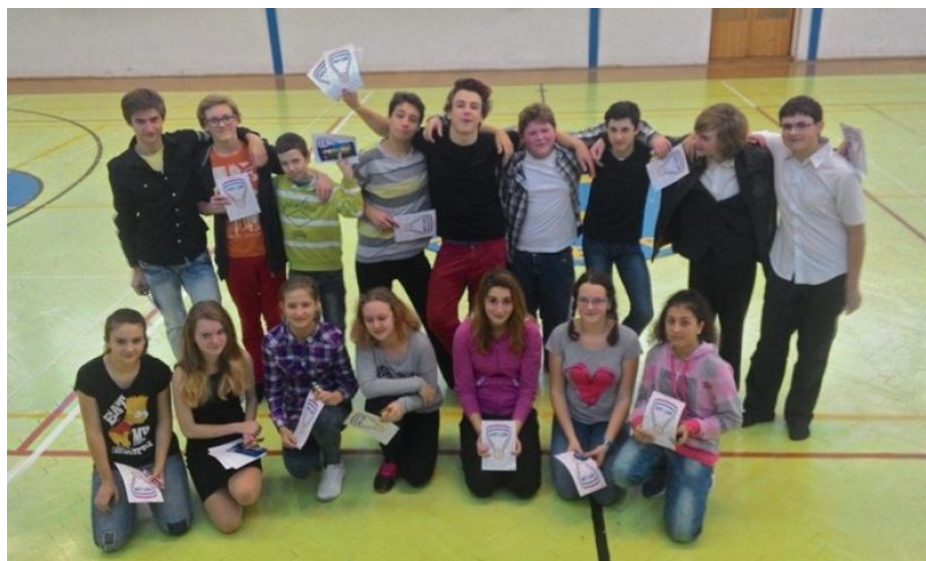
Vánoční basketbalový turnaj 2014