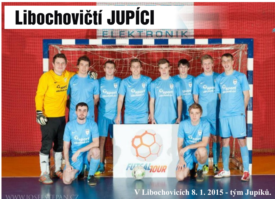
V Libochovicích 8. 1. 2015 - tým Jupíků.

Před třemi lety se sešla parta mladých lidí, která si chtěla zahrát fotbálek pro radost. Posléze jsme se začali scházet pravidelně a dohodli jsme se, že založíme futsalové družstvo a přihlásíme se do okresního přeboru na Litoměřicku. Postupně jsme začali získávat zkušenosti a výsledky se začaly dostavovat.