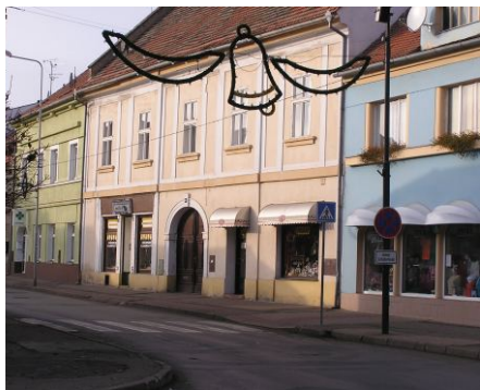
Dům v dnešní podobě.

Tento dům je postaven v ulici Doktora Vacka a vlastně díky tomuto domu dostala tato ulice své dnešní pojmenování. Původně měla jméno Koštická a to nejen k městské bráně, ale i za ní (nyní Tyršova a dále Fügnerova). Až v roce 1876, kdy se zpracovává nový katastr a pozemky města se dělí do tak zvaných Flúr, nebo také Niv a města jsou nucena pro lepší orientaci nějakým způsobem své ulice pojmenovat, dostává nové jméno „Purkyňova třída“, a to až do roku 1948 (krátce po válce „Třída Dr.Beneše“). V tomto roce vlivem nových politických pohledů na děj a život města se stává ulicí „Doktora Vacka“.