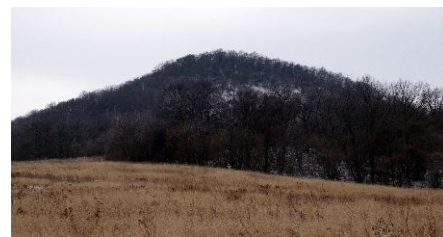
Zimní pohled na Boreč od Režného Újezdu.