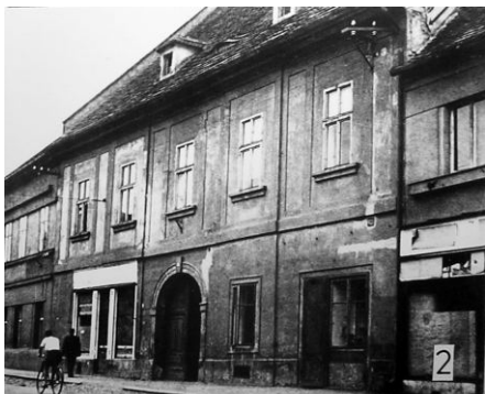
Dům v 50. letech minulého století.