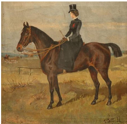
Obraz od Františka Štraybla.

Jinak byl oblíbeným a vítaným hostem na zámcích šlechty, kde maloval a kreslil ve stájích její čtvernohé miláčky, ušlechtilé