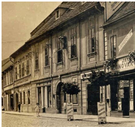
Dům ve 30. letech minulého století.