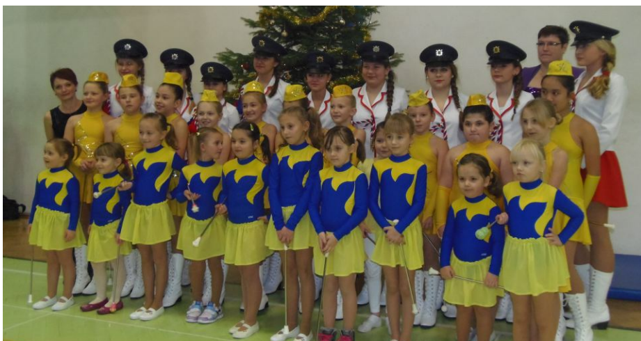
Společná fotografie z Vánočního pochodování.

Jménem děvčat bych ráda poděkovala všem našim příznivcům za podporu a popřála všem v novém roce hodně štěstí, zdraví a pohody. Jaroslava Svobodová