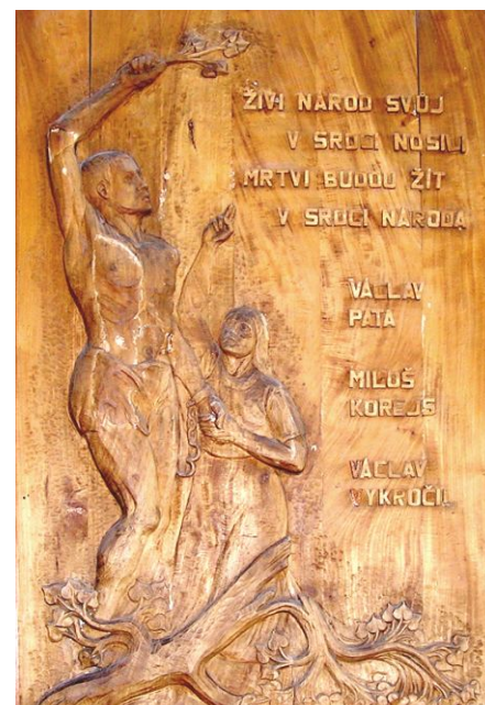
Pamětní deska umístěná v ZŠ J.E.Purkyně v Libochovicích.